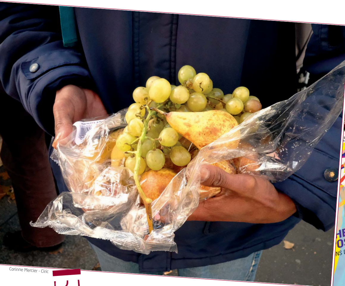
Corinne Mercier - Cric