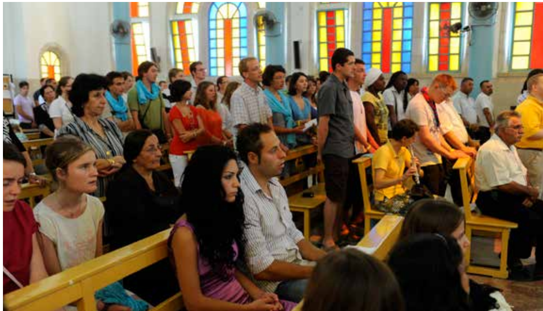
Un rituel dominical : la messe. Ici dans une église en Israël.

C'est aux rituels funéraires, en effet, qu'ils font remonter l'apparition de ce que nous appelons l'humanité : quand nos ancêtres décident d'enterrer et d'honorer leurs morts. C'est ainsi qu'ils constituent l'ébauche d'un premier collectif institué autour de valeurs communes.