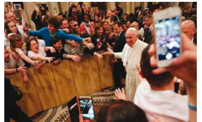
Le pape François à la rencontre des jeunes enthousiastes.

De nombreux éléments affectent la confiance des jeunes dans l'Église et dans les institutions qu'elle représente. Certains jeunes ont une vision erronée du modèle chrétien, ils ont une fausse image de Jésus et le ressentent comme un personnage éloigné de leur vécu. Ils perçoivent cette distance comme entretenue par les responsables hiérarchiques de l'Église. Le souhait des jeunes lors de ce synode est que l'Église réfléchisse à sa manière de les appréhender et qu'elle soit pour eux un véritable guide.