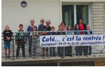
Un groupe de catéchèse à la maison de la Cigogne.

Les séances caté sont toujours enrichissantes. Les enfants nous apprennent et nous apportent beaucoup. Nous étions heureux de préparer ensemble les temps forts en 2Rives à Noël et pour l'entrée en Carême à Pellegrue. Réunis autour d'un café chaud, nous pouvions échanger et partager nos rires et nos réflexions. Les enfants ont apprécié les retraites à l'abbaye du Rivet. Ils demandent à retrouver les autres groupes pour vivre ensemble des temps forts, spirituels comme festifs. Ils sont heureux de pouvoir chanter aux messes des familles. Témoignage: « ... l'animation des messes des familles permet à des enfants en marge de la vie chrétienne de tisser des liens et de découvrir un lieu, une assemblée, des personnes portées par le même amour du Christ. Chanter le dimanche est l'aboutissement de leur investissement ».