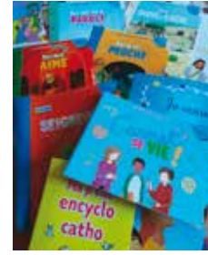
Les documents qui accompagnent la catéchèse.

Agnès Moreau, responsable de la catéchèse côté Dordogne