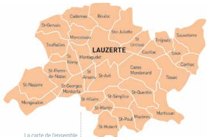
La carte de l'ensemble paroissial de Lauzerte

Publication de l'ensemble paroissial de Lauzerte - Trimestriel - Directeur de la rédaction : abbé Émile Kofor.