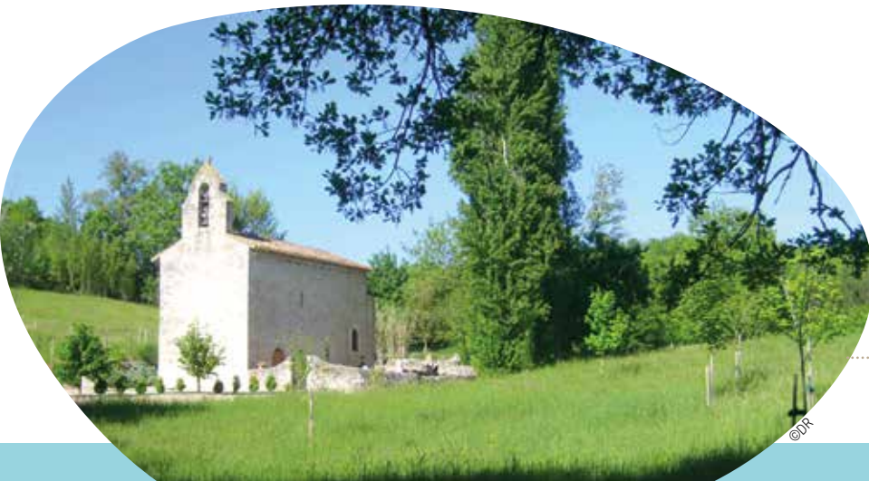
Chapelle Saint-Sernin-du-Bosc du XI e siècle à Lauzerte, sur le chemin de Saint-Jacques