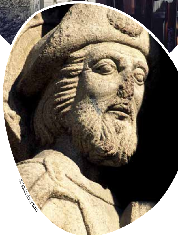
Saint Jacques le Majeur, apôtre. Sculpture du portail du collège San Jeronimo (piédroit à gauche du portail). Sculpture du XII e siècle. Saint-Jacques-de-Compostelle, Galice, Espagne.