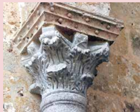
► Un des chapiteaux antiques réemployés à Genens.