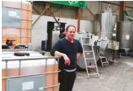
L'entreprise fonctionne 7 jours sur 7, 24h sur 24.

Aujourd'hui la production dépasse les 1 800 tonnes par an, réparties sur 1 200 tonnes de tourteaux et 600 tonnes d'huile, écoulées soit en bouteilles, 80 %, soit en huile de friture ou pour les biscuiteries, ou la cosmétique. Les marques partenaires sont françaises mais aussi européennes. L'huilerie gersoise est reconnue par les plus grandes marques pour la qualité de ses huiles.