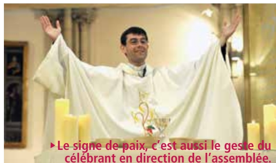
► Le signe de paix, c'est aussi le geste du célébrant en direction de l'assemblée.

La congrégation rappelle d'abord que le geste de paix n'est pas « mécanique » et que le célébrant peut tout à fait se dispenser d'inviter les fidèles à échanger la paix. Plus profondément, la congrégation insiste sur le sens profond du geste de paix par