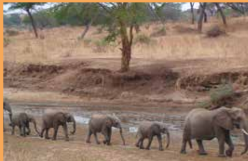
Éléphants en famille, cratère du Ngorongoro (Tanzanie)

L'homme a modifié les caractères génétiques des animaux domestiques à sa convenance. Parfois, on remarque chez les bovins, la dominance d'une vache, pas la plus facile, qui est respectée par tout le troupeau. Ce caractère semblerait se transmettre à sa fille. Chez les animaux sauvages, la vie en société est la plus fréquente, du moins au début. Adultes, certaines espèces, comme le blaireau, l'écureuil roux, l'ours polaire, peuvent vivre en solitaire. Là, intervient une notion de territoire nécessaire à leur existence. Les jeunes s'associent avec la mère jusqu'au moment du sevrage. Le terme de troupeau est employé pour les herbivores. Ceux-ci se rassemblent pour la protection contre les prédateurs. Le grand nombre permet la surveillance du territoire, alternée avec le broutage, et la diminution du risque individuel en cas d'attaque. Il permet aussi l'opposition massive et la défense (gnous, buffles). Chez les prédateurs, la « meute » est un groupe de chasse qui nécessite un certain niveau de coordination et de différenciation des rôles. Leur nombre est plus petit, car la répartition du festin doit être à la mesure de la proie.