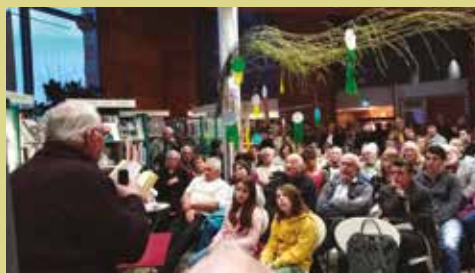
Lecture d'un conte lors de la soirée dédiée à l'exposition d'Hermann Heinzel.