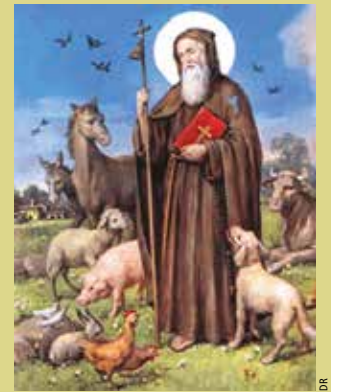
► Saint Antoine, le patron des paysans et des animaux domestiques.

des progrès indéniables: le cardinal Donnet, archevêque de Bordeaux de 1834 à 1882 encourage l'apiculture, prônant l'abandon du joug au profit du collier d'épaule et surtout de meilleurs soins pour le bétail. Le clergé va ainsi œuvrer au bon traitement des animaux, marquant un changement dans leur perception, la création ne serait pas toute entière destinée au service de l'homme.