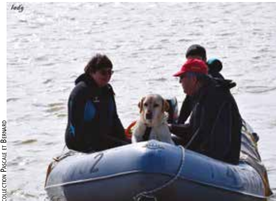
Ici avec leur labrador.

En 2015 nous avons créé l'association : « Les gardiens de la mer », basée au lac de l'Uby à Cazaubon, où nous entraînons des chiens nageurs. L'entraînement dure 1/4 d'heure, ils apprennent à nager à contre-courant : il