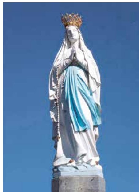
Marie, reine du Ciel, nous montre la voie.