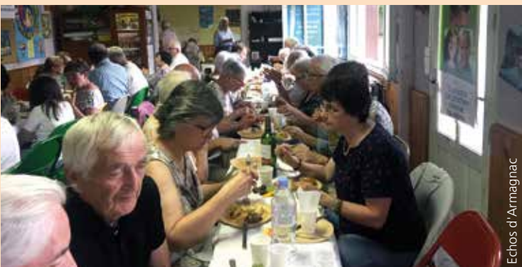
► Tous réunis pour dire « Merci ».