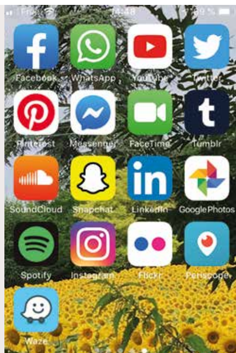
► Les principaux réseaux sociaux.

Pour en savoir plus : Les 24 réseaux sociaux les plus populaires en France et dans le monde (fév. 2019) : https://www.leptidigital.fr/reseaux-sociaux/liste-reseaux-sociaux-14846/