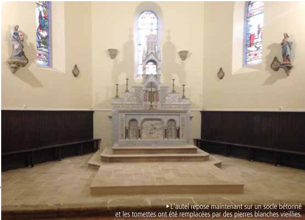
► L'autel repose maintenant sur un socle bétonné et les tomettes ont été remplacées par des pierres blanches vieilles.

La sauvegarde du patrimoine est une obligation vis-à-vis des générations qui nous ont précédés. La rénovation de l'église du village en est une illustration particulièrement réussie.