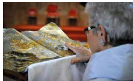
► La vénération des reliques, un acte de piété.

S ignes sensibles et sacrés, qui tout en ayant une analogie avec les sacrements, n'en sont pas. Ils sont porteurs d'une réalité spirituelle. Les sacramentaux sont, pour l'essentiel, des consécrations de personnes et des bénédictions. Ce sont des rites sacrés personnels ou institués par l'Église dans le but de sanctifier certaines circonstances de la vie. Ils comportent une prière accompagnée du signe de la croix et d'autres signes. Parmi les sacramentaux, les bénédictions occupent une place importante. Elles sont une louange à Dieu et une prière pour obtenir ses dons ; de même, il y a les consécrations de personnes ou d'objets dont l'usage est réservé au culte. Le sens religieux du peuple chrétien a, de tout temps, trouvé son expression dans des formes variées de piété qui entourent la vie sacramentelle de l'Église, telles que la vénération des reliques, les visites aux sanctuaires, les pèlerinages, les processions, le chemin de croix, le Rosaire. À la