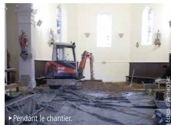
► Pendant le chantier.