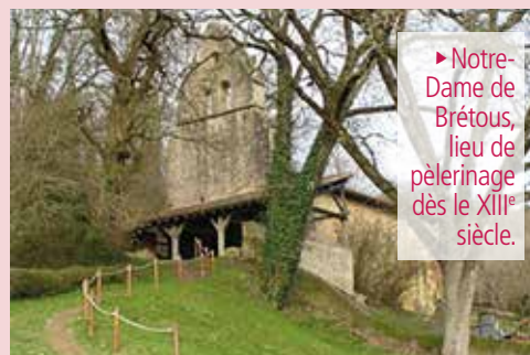
► Notre-Dame de Brétous, lieu de pèlerinage dès le XIII e siècle.

À environ un kilomètre de Saint-Arailles, la chapelle Notre-Dame de Brétous, dont la première mention remonte à 1080 est inscrite aux monuments historiques depuis 1943. Accrochée à mi-pente du coteau, dans son nid de verdure, surplombant le cimetière et la fontaine miraculeuse, on l'atteint par un petit raidillon de terre ; une rampe facilite la montée. Elle est surmontée à l'ouest par un clocher-mur et se termine à l'est par un chevet gothique à 5 pans. Le clocher-mur comporte 3 ouvertures, mais pas de cloches. À l'intérieur la nef est simple. Le plafond de bois a été refait il y a quelques années et le sol est de carreaux de terre cuite. L'autel en bois, surélevé d'une marche, date de 1855. On devine sous le crépi les restes de tout un décor peint qui couvrait l'ensemble du chœur. En redescendant, les saules pleureurs abritent la fontaine, réputée autrefois pour guérir les maladies des yeux et les rhumatismes. Le village de Saint-Arailles est un des rares castelnaux restaurés. La pile gallo-romaine de la Tarraque du Merlieu, le lavoir et l'église de Saint-Jean-d'Anglés sont en cours de restauration. Une belle promenade pittoresque et vallonnée.