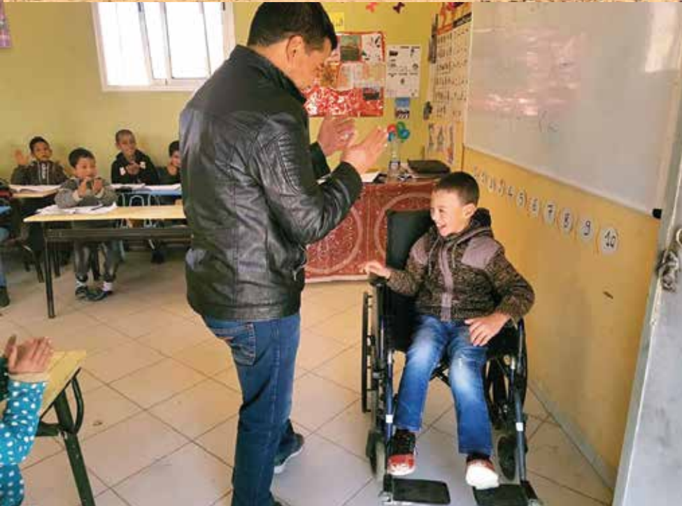
► L'enfant handicapé reçoit le fauteuil en compagnie du responsable du raid.