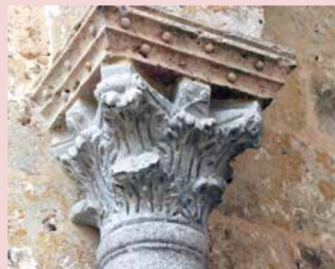
► Un des chapiteaux antiques réemployés à Genens.