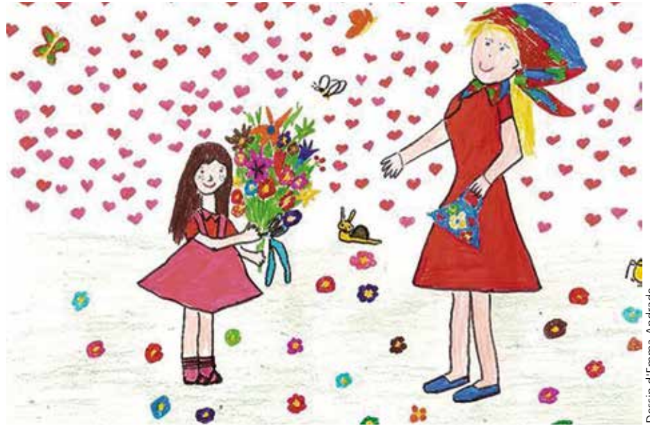
Dessin d'Emma Andrade

Sans aller jusqu'à cette extrémité funeste, ce commandement ne demande pas d'obéir ou de copier ses parents, ni même de rester avec eux, mais certainement de les traiter avec justice et res-