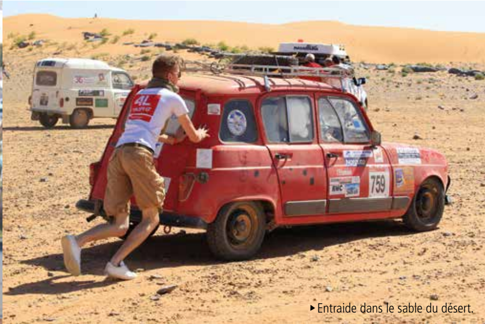
► Entraide dans le sable du désert.