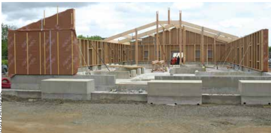
► Des matériaux naturels pour la construction.

Notre secteur armagnacais est hautement concerné, en particulier la commune d'Éauze.