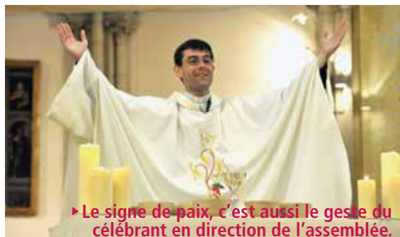
► Le signe de paix, c'est aussi le geste du célébrant en direction de l'assemblée.

La congrégation rappelle d'abord que le geste de paix n'est pas « mécanique » et que le célébrant peut tout à fait se dispenser d'inviter les fidèles à échanger la paix. Plus profondément, la congrégation insiste sur le sens profond du geste de paix par