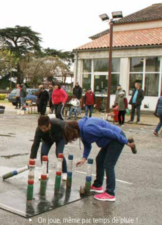
► On joue, même par temps de pluie !

>Pourensavoirplus,unevidéo: https://www.youtube.com/watch?v=uPK_pnv2tAY