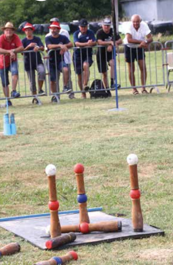
► Des connaisseurs dans l'assistance.