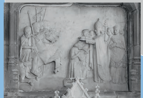
Le départ de Saint-Louis pour la croisade Retable en marbre de François Mahoux (1869)

En juillet 1899, il fut nommé chevalier des Palmes académiques. Les insignes lui furent remis le 14 août. Le bon sculpteur ne devait survivre qu'une année à cette apothéose. Il s'éteignit brutalement le 5 avril 1901.