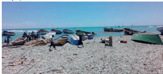
Le port de Marigot