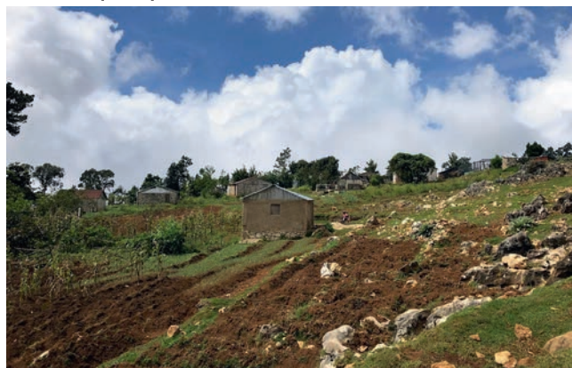
Un village haïtien typique

Thomas : Ma mission était l'alphabétisation et la sensibilisation à la gestion des déchets. Les élèves allaient du CE2 jusqu'à la terminale. Ils ne vivent pas dans les mêmes conditions que nous. Dans la classe, il y a juste un tableau, une craie et pas de fenêtre. Quand il pleut, les élèves partent vite car ils peuvent être bloqués par les inondations.