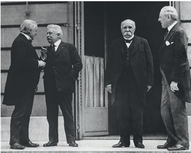
Les Big Four (de gauche à droite) : David Lloyd George, Vittorio Emanuele Orlando, Georges Clemenceau et David Woodrow Wilson.

Le conseil supérieur des Alliés est créé dès le début de la conférence et se déroule à huis clos. Ce conseil est composé des États-Unis, de la France, de l'Angleterre, de l'Italie et du Japon.